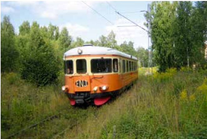
ENJ 1 passerar Engelsbergs Bruk som återgående tjänstetåg från Snyten.

Årets sista resa gick till Bergslagen helgen 26–27 augusti. Resan startade i Ängelsberg där vi bordade en Volvobuss från 1955 för vidare färd till Smedjebacken. Där fick vi en visning av lokstall och sjömagasin innan det var dags att gå ombord på ångfartyget RUNN för en tur på sjön Barken. I Söderbärke hade medlemmar från föreningen Barkens Ångbåtar dukat upp en överdådlig picknicklunch. Sedan blev det ny bussresa till Fagersta, där vi tog in på Brukshotellet. På kvällen kunde vi besöka Bruksmuseet och lyssna på ett föredrag om Ekomuseum Bergslagen.