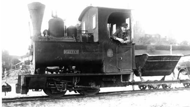
Det lilla 600 mm-ångloket PYSEN (Decauville 60/1889) från Kosta-Lessebo Järnväg hamnade år 1932 som entreprenadlok i Kalmar då Slottsfjärden skulle muddras. Sedan arbetena avslutats ställdes loket i förråd, men då ångpannan var i dåligt skick kom det att skrotas knappa 20 år senare.