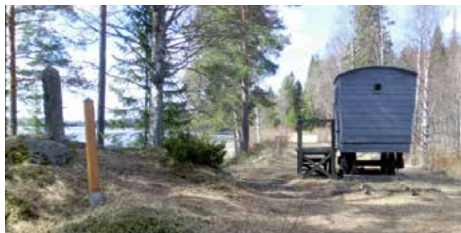
Arkeologipromenaden längs Österströms Järnväg, Medelpads första järnväg med ångdrift från 1873. Till höger ”Kupén”, banans enda personvagn, som kunde hyras för 37 öre och kopplas till timmertåget för en tur till Glimberget där timret släpptes i en 653 meter lång torränna ner till Indalsälven.

Programmet omfattade historik över 90-årsfirande OKB, liksom en del om vänföreningen OKBv, föredrag av Olle och Viola Ek om resor i södra Afrika, filmvisning och historik om Österströms Järnväg, och i maj en arkeologivandring längs samma bana.