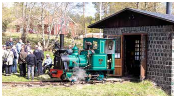
Framför lokstallet LOKE, som snart ska koppla på vagnarna för att senare köra en tur med SJK:s medlemmar.

Helgen 20–21 maj var det dags för den årliga årsmötesresan, som gick till Norrland. Resan startade från Stockholm C med tåg från Sveriges Järnvägmuseum draget av Rc1 I Ljusdal gjordes upphåll för lunch, som serverades i den bevarade miljön i gamla järnvägshotellet. Där blev vi även uppmärksammade av lokalpressen, som gjorde ett stort reportage. Nästa stopp gjordes i Ragunda där det fina lilla museet i stationen förevisades. Slutstation för tåget denna