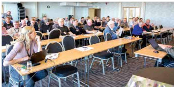
SJK:s medlemmar inför årsmötet i Sollefteå.